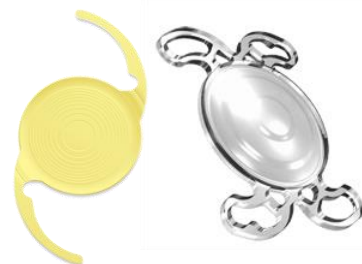
(右) MiniWell (SIFI/イタリア) (左) シンフォニー(AMO) 多焦点眼内レンズ(EDOF) 当院取扱中

2重焦点は「先進医療」として厚生労働省に承認されていますが3重焦点は先進医療として承認されていないので、術前術後の診察・検査・手術代(レンズ代含)に関わる治療代全て「自費診療」となります。【詳しくはスタッフに御相談ください】