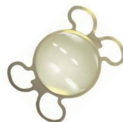
FineVision (PhysIOL/ベルギー) 3重焦点眼内レンズ 当院取扱中